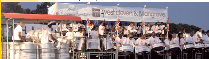
Zmena programu vyhradená. V prípade nepriaznivého počasia sa podujatia nekonajú.

Organizátorom KULTÚRNEHO LETA je MESTO TRENČÍN