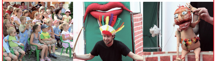
Zmena programu vyhradená. V prípade nepriaznivého počasia sa podujatia nekonajú.

Organizátor Trenčianskeho kultúrneho leta MESTO TRENČÍN