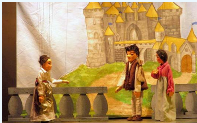
Bábkové divadelné predstavenie pre deti.